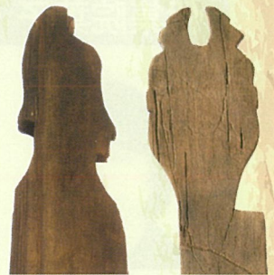
青谷横木遺跡の男女の人形