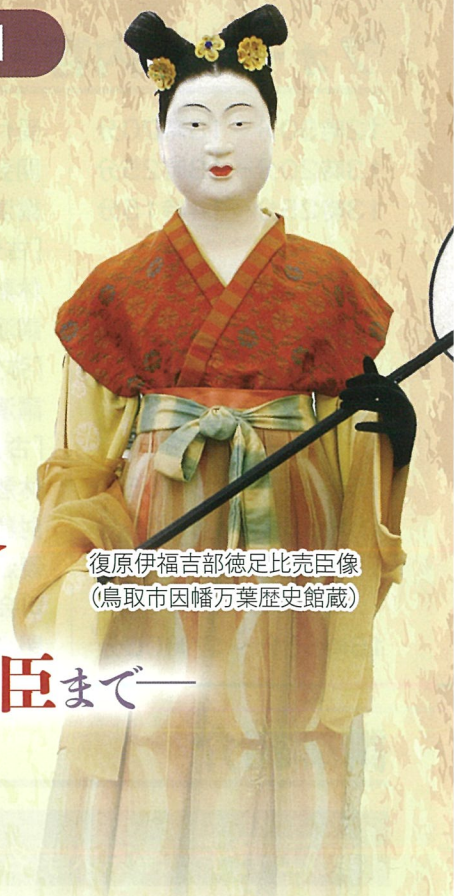
復原伊福吉部徳足比売臣像 (鳥取市因幡万葉歴史館蔵)