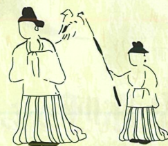
青谷横木遺跡女子群像板絵 (復元図)