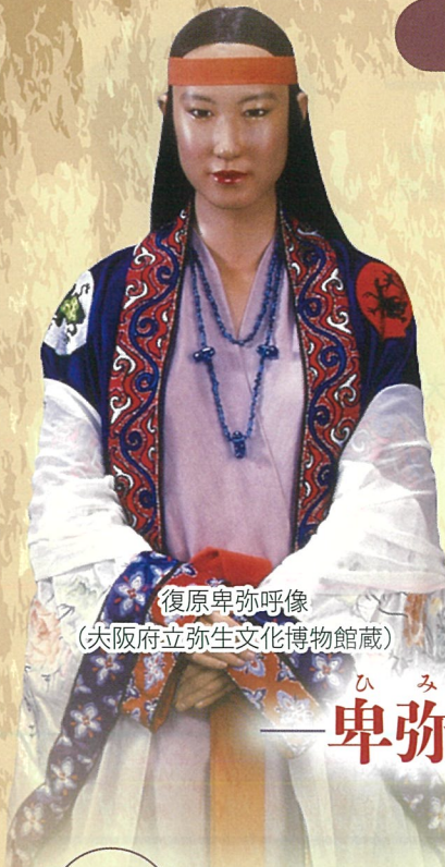
復原卑弥呼像 (大阪府立弥生文化博物館蔵)